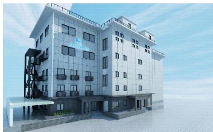
图1 省港口工程公司办公楼效果图

福建省港口工程有限公司组建于1958年，是福州港务集团有限公司所属全资子公司，注册资本金8000万元，具有港口与航道工程施工总承包贰级、房屋建筑工程施工总承包贰级、建筑装修装饰工程专业承包贰级、地基基础工程专业承包贰级、钢结构工程专业承包贰级、消防设施工程专业承包贰级、建筑防水防腐保温工程专业承包壹级等专业承包资质，是一个拥有雄厚技术、设备、经济实力和综合施工能力的国有全资企业。